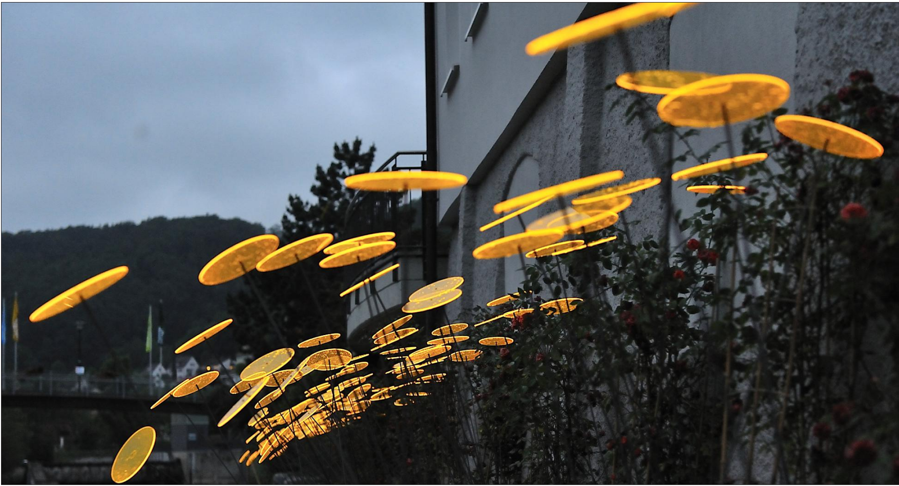
Sorgen für Farbtupfer auf dem Gartenschau Gelände: die »Sonnenfänger«